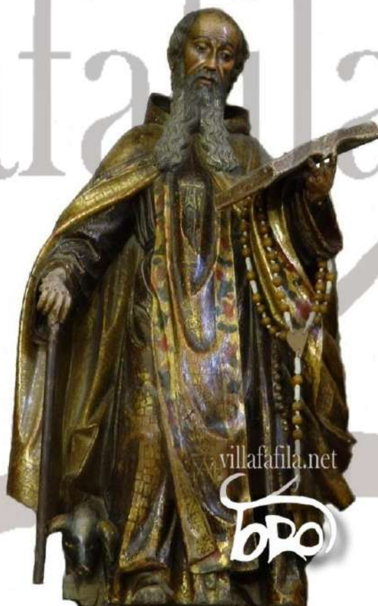
San Antonio Abad o San Antón