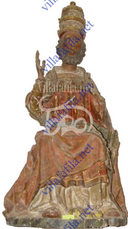
Imagen de San Pedro